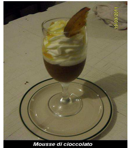
Mousse di cioccolato