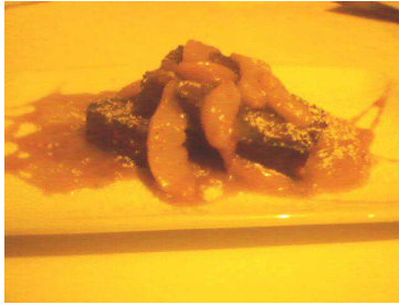
Lonjas de bizcocho "pan di spagna" con laminas de fruta, flambeada