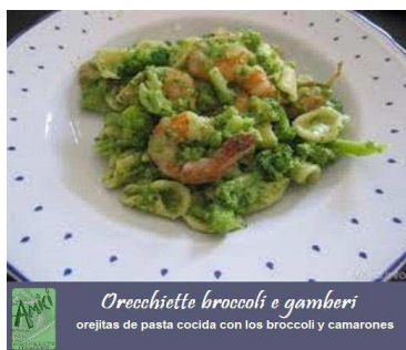
Orecchiette broccoli e gamberi orejitas de pasta cocida con los broccolli y camarones