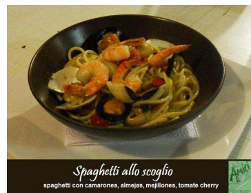
Spaghetti allo scoglio spaghetti con camarones, almejas, mejillones, tomate cherry

mejillones, almejas, calamares, camarones y tomate cherry