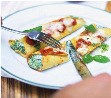
Crepe Spinaci e Gamberetti crepe de espinaca y queso ricotta