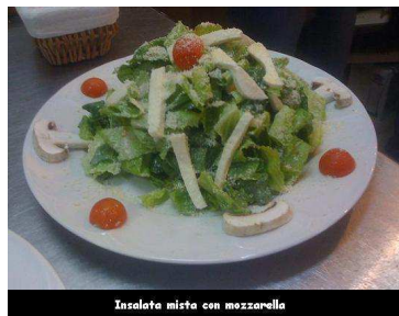
Insalata Mista Amici

Ensalada mixta de lechuga riza, tomate, zucchini, aceitunas negra, champiñones,