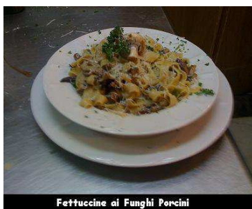
Fettuccine ai Funghi Porcini

fettuccine casero en salsa de crema de leche y hongos "porcino"